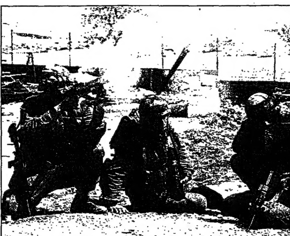
جندي اسرائيلي يطلق قنابل مسيلة الدموع بينما يقضي من زملائه خلف جدار خرفا من شبان يرشقونهم بالمجازرة

وقال اللواء الإسرائيلي الذي قاد العملية العسكرية في الباقورة ان «الجندي الذي قتل الملك حسين كان يجب ان يقتل في موقعه». وقال اللواء الإسرائيلي الذي قاد العملية العسكرية في الباقورة ان «الجندي الذي قتل الملك حسين كان يجب ان يقتل في موقعه». وقال اللواء الإسرائيلي الذي قاد العملية العسكرية في الباقورة ان «الجندي الذي قتل الملك حسين كان يجب ان يقتل في موقعه».